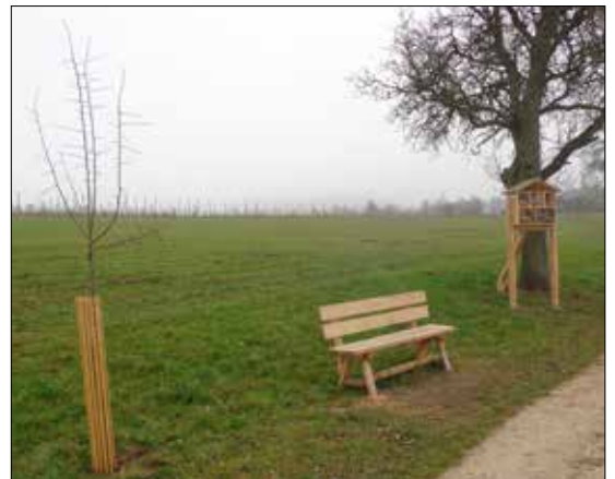
Der Mostbirnbaum, das Gemeindebankerl und das Insektenhotel (aufgestellt von der NMS Schörfling) in der Karl-Hausjell-Allee