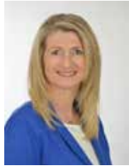
Referentin für Wirtschaft und Umwelt