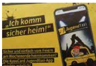
Jugendtaxi App, Gemeinden & Jugend, Projektträger: Verein 4YOUgend