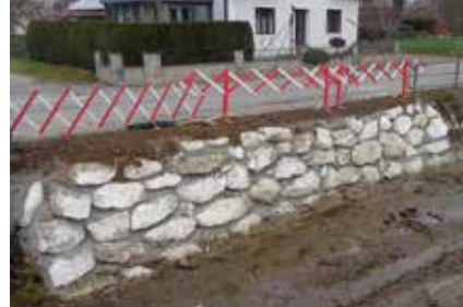
Sickingerstraße Abzweigung Schönbachstraße

Auch heuer wurden im Rahmen des Betreuungsdienstes der Wildbach- und Lawinverbauung wieder Sanierungen durchgeführt.