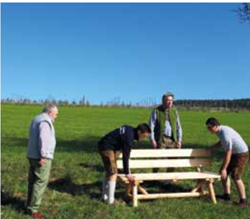
TV1 Videodreh: Gemeindebankerl in Schörfling am Attersee

Alle Gemeindebürger sind herzlich eingeladen, das neue Gemeindebankerl in der Karl-Hausjell-Allee zu besuchen, um den Ausblick zu genießen.