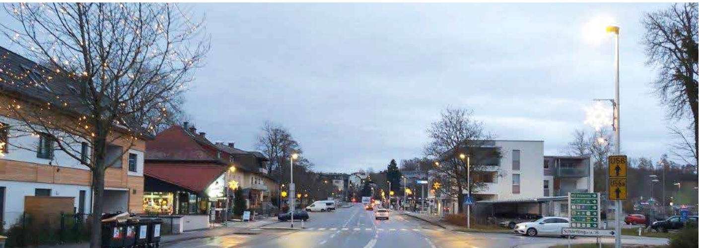
Ein Teil der Weihnachtsbeleuchtung wurde erneuert und auf LED umgestellt.