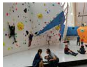
Kletterhalle St. Georgen/Attergau, Sport & Freizeit, Projektträger: MSU Attergau-Attersee