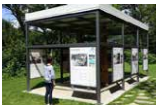
Ager Mühlen Weg, Natur & Kultur, Projektträger: Marktgemeinde Lenzing